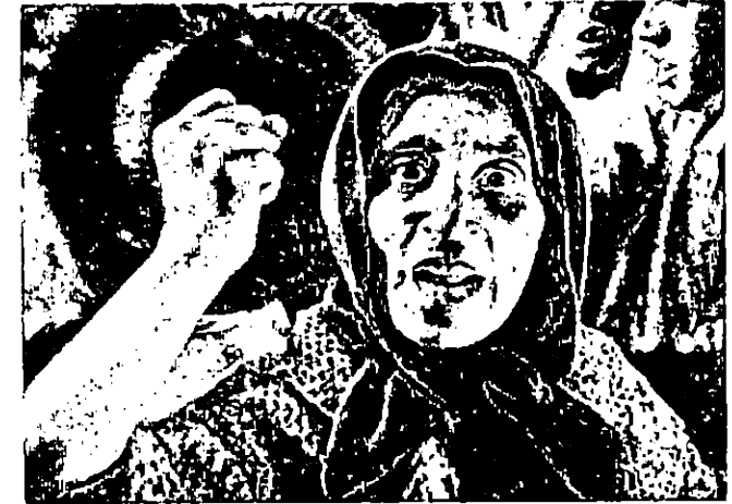
• LE CUIRASSE POTEMKINE • : SEQUENCE DES FUNERAILLES DE VAKOULINTCHOUK (SUITE).